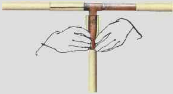
Anpassen der Mantelstücke bei einer T-Verbindung.