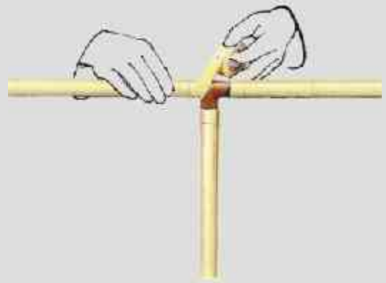
Nachisolation mit Coroplastband.